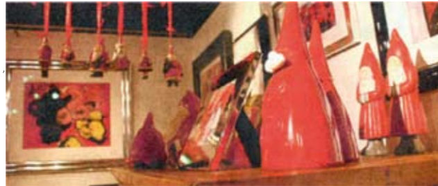
Rot und Weiß dominieren im Nähzimmer der Schmieds.

Die Außenanlage mit Terrasse und Rasenfläche ist ebenfalls Galerie – dort sind die Kunstwerke allerorts wetterfest auf Alu-Dibond-Platte gedruckt. Erstmals mit einbezogen ist das architektonisch auf das Haupthaus ausgerichtete Garten-Atelier, das kleine